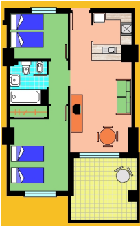
Una planta con 1 habitación